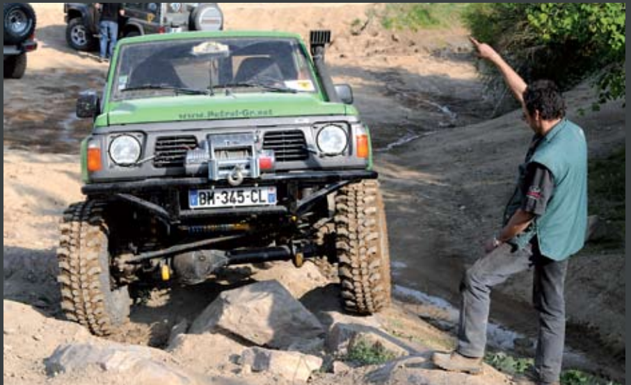
Crapahutage, soirées de partage et d'échange, apéro et tirages au sort, de nombreux membres du PGR ne sont pas repartis les mains vides. Et c'est tant mieux !